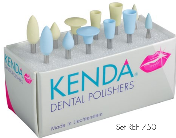
Set REF 750

Meistverkaufter Polierer für alle mikrogefüllten Kompositmaterialien. Der Polierer erzielt strahlend glatte Zahnoberflächen mit lang anhaltendem Hochglanz. Er eignet sich auch bestens für ein einfaches Entfernen von Zementresten orthodontischer Bänder (Brackets).